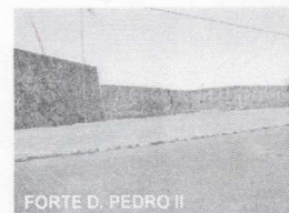
FORTE D. PEDRO II

CNPJ: 88.142.302/0001-45 - Fone/fax: (55) 3281 1351 - Rua XV de Novembro, 438 - Caçapava do Sul - RS