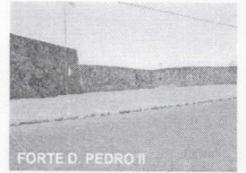
FORTE D. PEDRO II

CNPJ: 88.142.302/0001-45 - Fone/fax: (55) 281 1351 - Rua XV de Novembro, 438 - Caçapava do Sul - RS