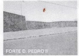
FORTE D. PEDRO II

CNPJ: 88.142.302/0001-45 - Fone/fax: (55) 3281 1351 - Rua XV de Novembro, 438 - Caçapava do Sul - RS