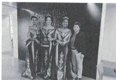
Comitiva da Festa do Azeite realiza entrega de convites na capital

Reunião no Palácio do Governo apresenta o prejuízo de quase R$ 9 milhões com chuvas em Caçapava