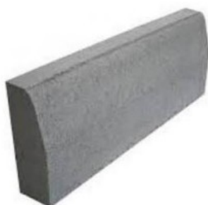
Figura 1 - Meio-fio de concreto.