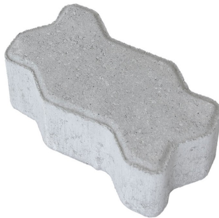
Figura 2 - Bloco de concreto modelo onda/ 16 faces, 22cm x 11cm, E= 10cm