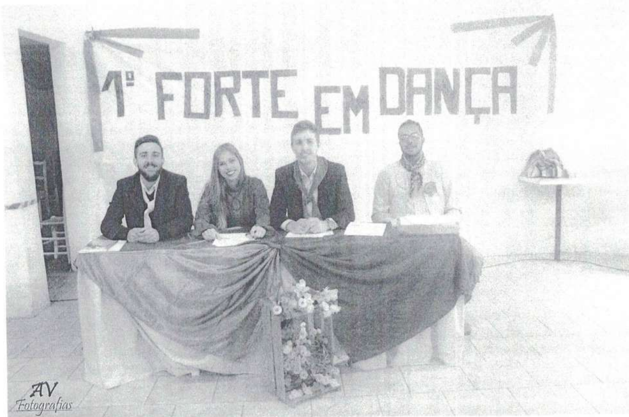
Comissão avaliadora danças gauchas de salão