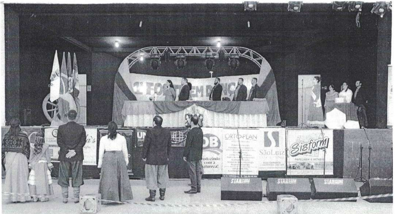
Troféus do 1º Forte em Dança