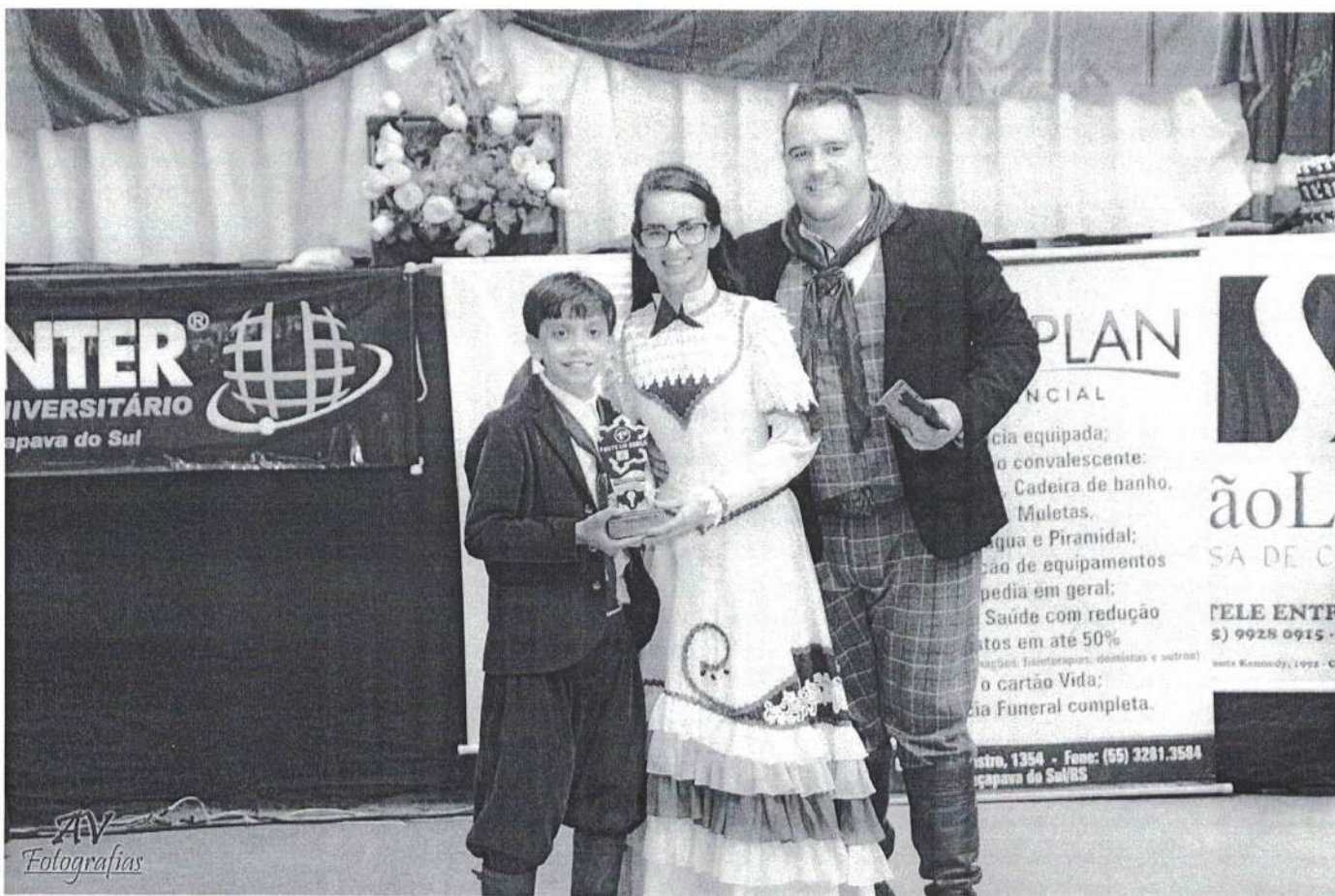
Entrega da Premiação