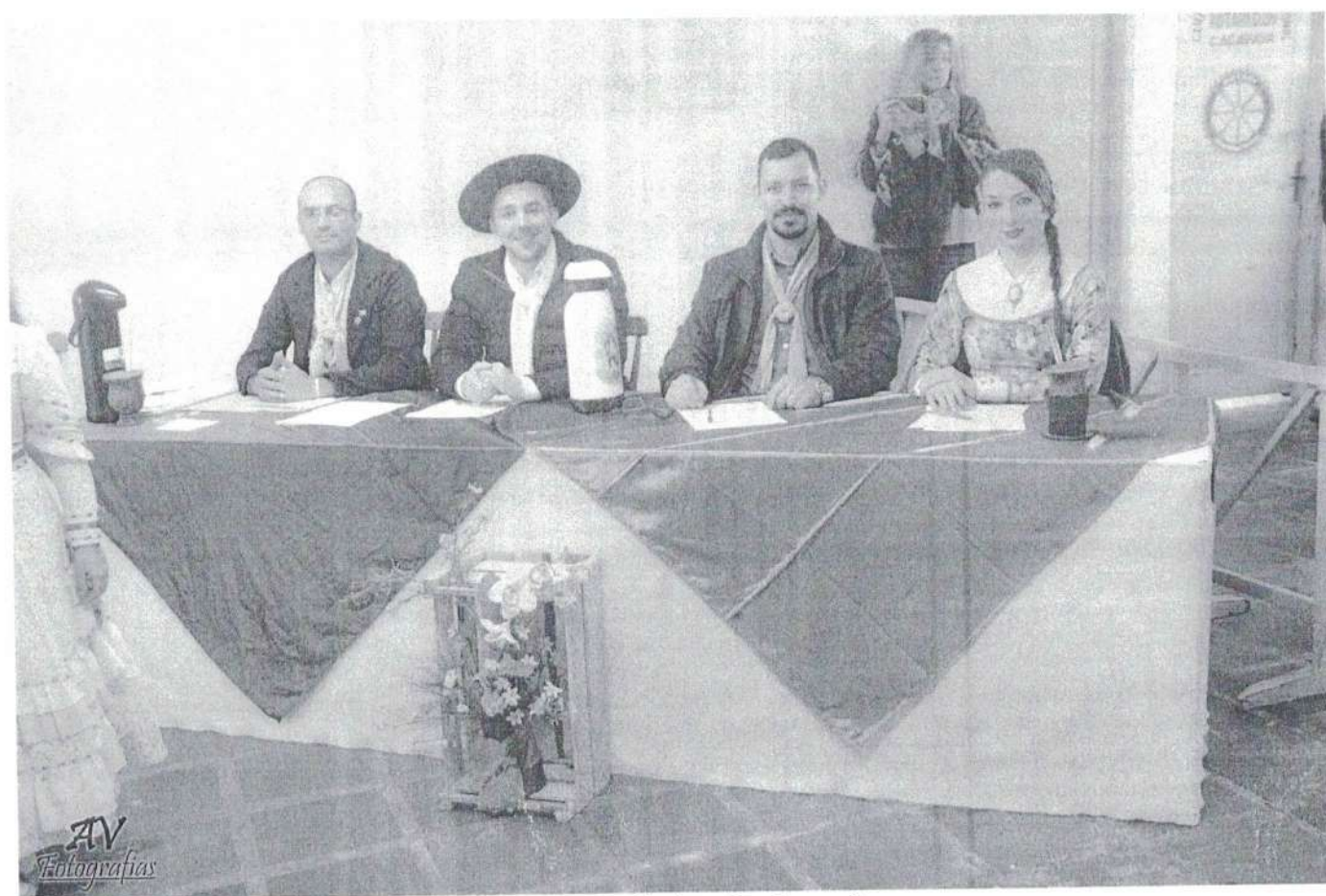
Comissão avaliadora Declamação

Handwritten signatures in blue ink, including a stylized 'H', 'gky', and 'SA'.