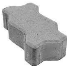
Figura 2 - Bloco de concreto de 16 faces.

Os blocos a serem empregados, serão de concreto vibro prensado, com resistência final à compressão e abrasão de no mínimo 35 Mpa, conforme normas da ABNT, afim de garantir com segurança a solicitação de veículos leves, veículos comerciais e tráfego de pedestres. Deverão ser observadas as espessuras de cada tipo de piso, sendo que o bloco utilizado terá espessura de 10 cm e dimensões de 20x10 cm (FIGURA 2). O nivelamento superior das peças deverá ser perfeito, sem a existência de desníveis, degraus ou ressaltos.