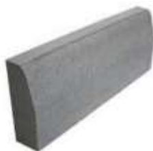
Figura 1 - Meio-fio de concreto.