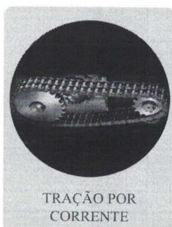
TRAÇÃO POR CORRENTE