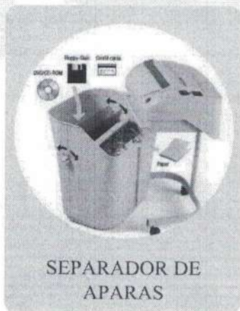
SEPARADOR DE APARAS