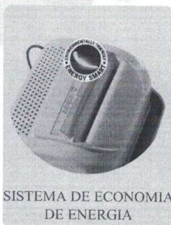
SISTEMA DE ECONOMIA DE ENERGIA