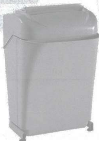
KOBRA 240 SS5 Tiras: 5,8 mm