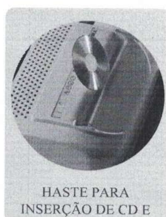
HASTE PARA INSERÇÃO DE CD E CARTÕES