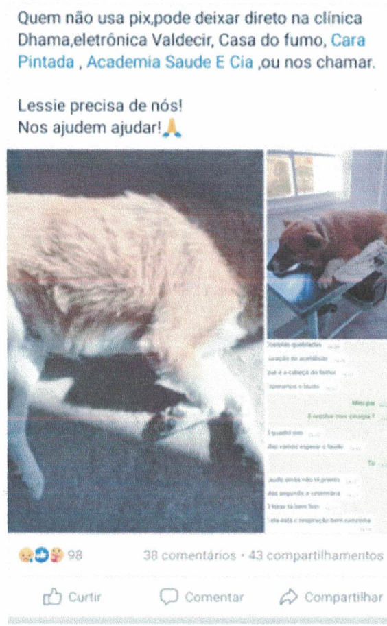
Figura 02 e 03 - Resgate de cão comunitário vítima de atropelamento.