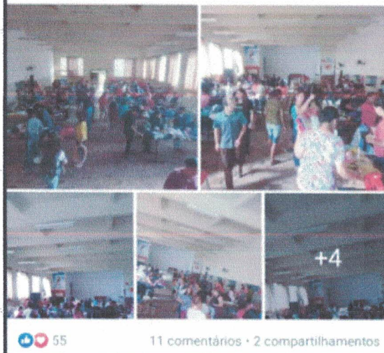
Figura 04 e 05 - Ação beneficente para levantamento de recursos para despesas da Ong.

Nosso brechó foi maravilhoso! 🍌🍌 Obrigada a todos envolvidos! 🙏❤️🐾