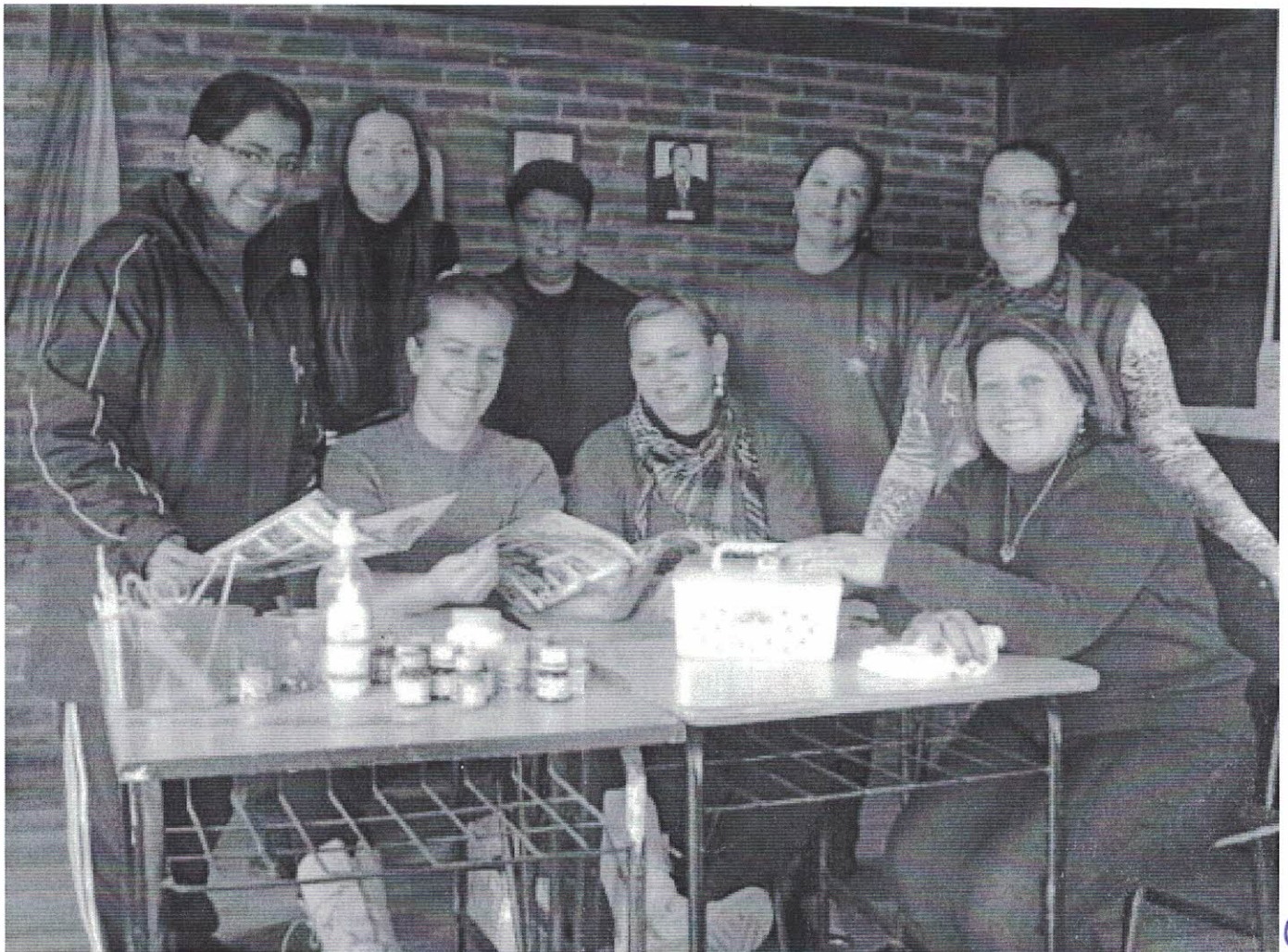
Artesanato em biscoito na Escola Augusto Victor Costa

Handwritten signatures and initials in blue ink, including 'CB' and 'JA'.