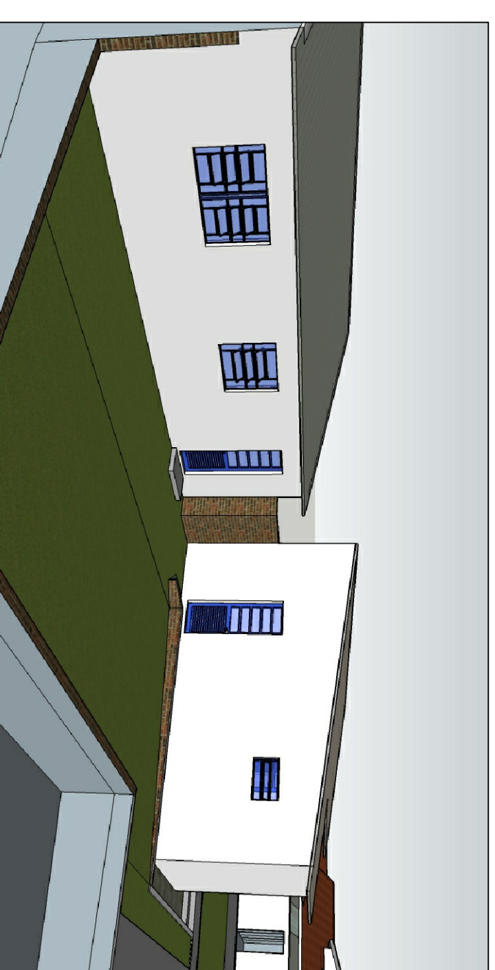
PÁTIO DOS FUNDOS