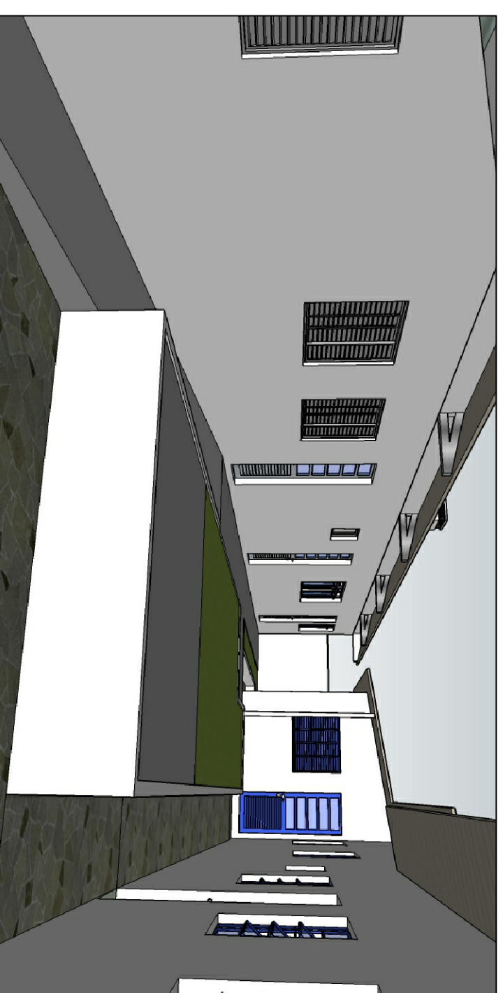
PÁTIO E REFEITÓRIO