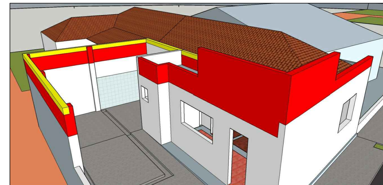
ALVENARIA À CONSTRUIR - FACHADAS SUL E OESTE E ABRIGO DA AMBULÂNCIA