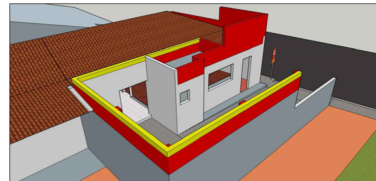
ABRIGO DA AMBULÂNCIA (ALVENARIA COMPLEMENTAR E CINTA DE AMARRAÇÃO)