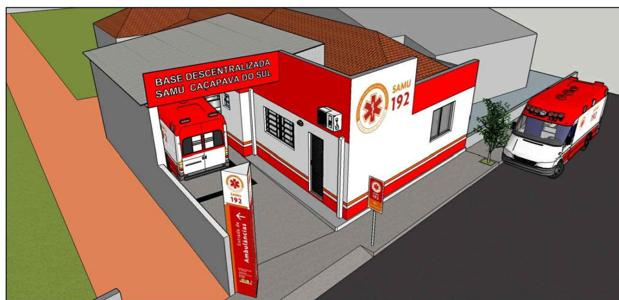
FACHADA FRONTAL E COBERTURA