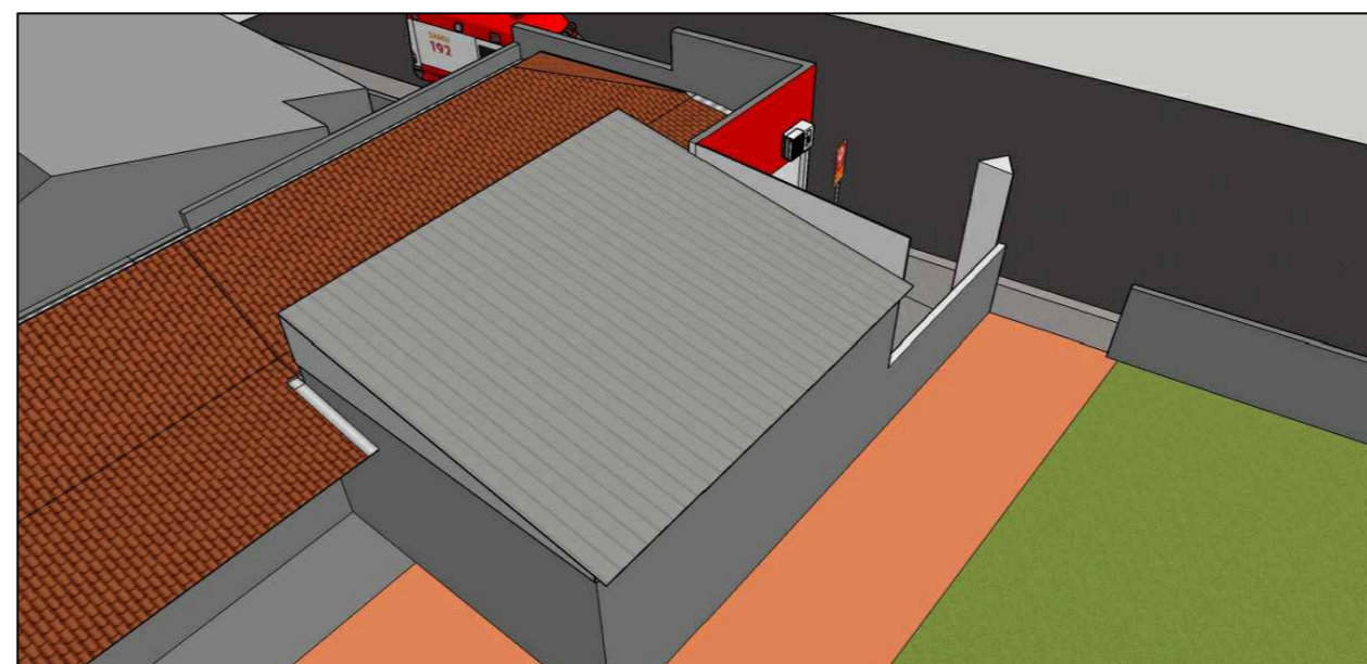
COBERTURA DO ABRIGO DA AMBULÂNCIA (VISTA DOS FUNDOS)