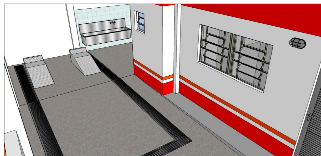
ABRIGO DA AMBULÂNCIA - CANALETA PARA COLETA DE RESÍDUOS, RAMPAS MÓVEIS PARA AMBULÂNCIA E TANQUE DE AÇO INOXIDÁVEL

■ ALVENARIA DE TIJOLOS MACIÇOS ■ CINTA DE AMARRAÇÃO EM CONCRETO ARMADO