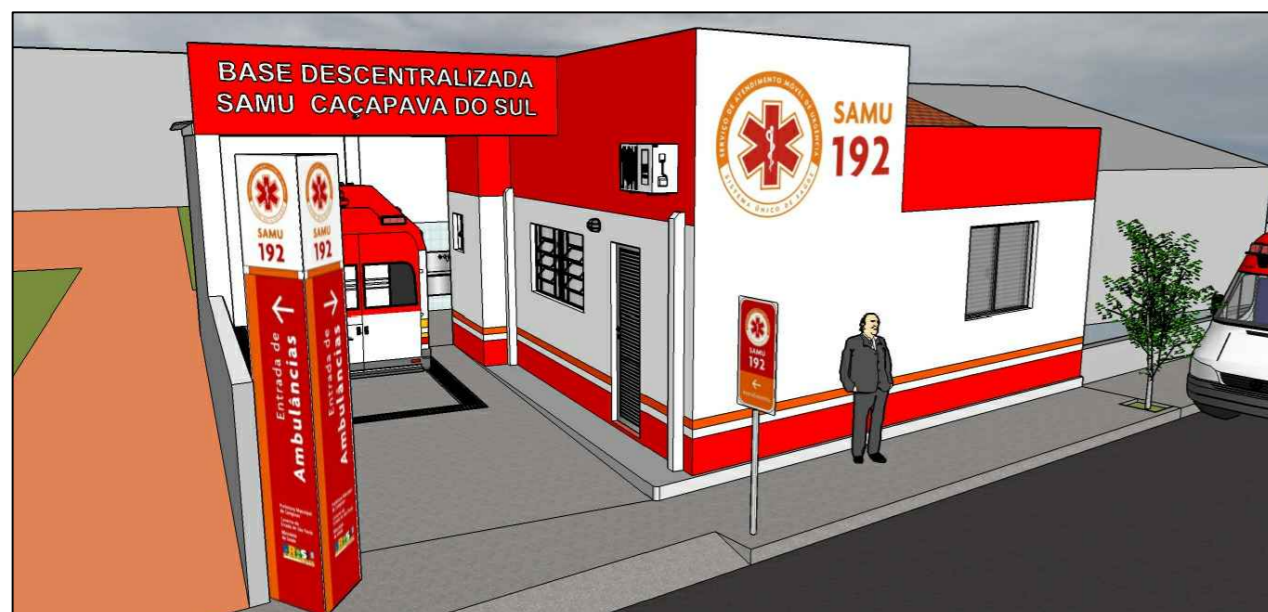
FACHADAS FRONTAL E LATERAL