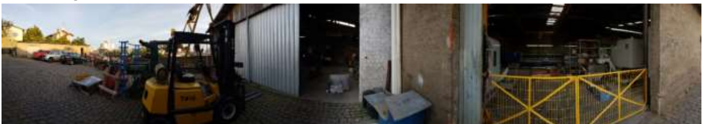
Imagem 360° do local:

Seguem fotos internas da assistência técnica: