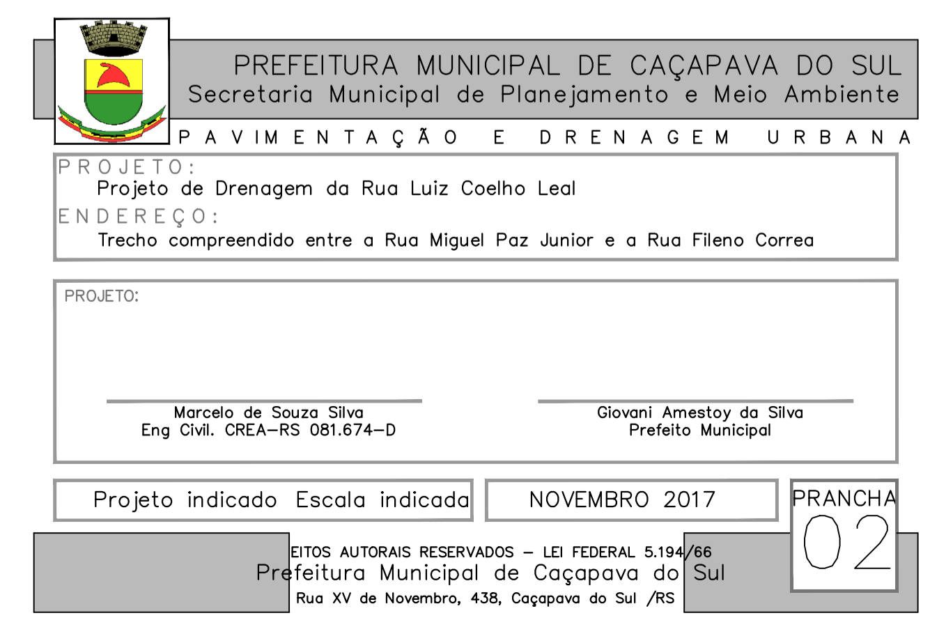
Rua Ver. Luiz Coelho Leal Escala 1/750

LEGENDA — Perfil do terreno - - - - - Tubo 0,90cm