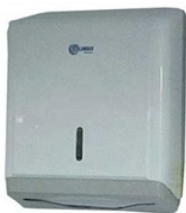
Porta papel toalha interfolha

Deverão ser instalados dispensers para papel toalha interfolha, em polipropileno, para papel toalha tanto de 2 como de 3 dobras.