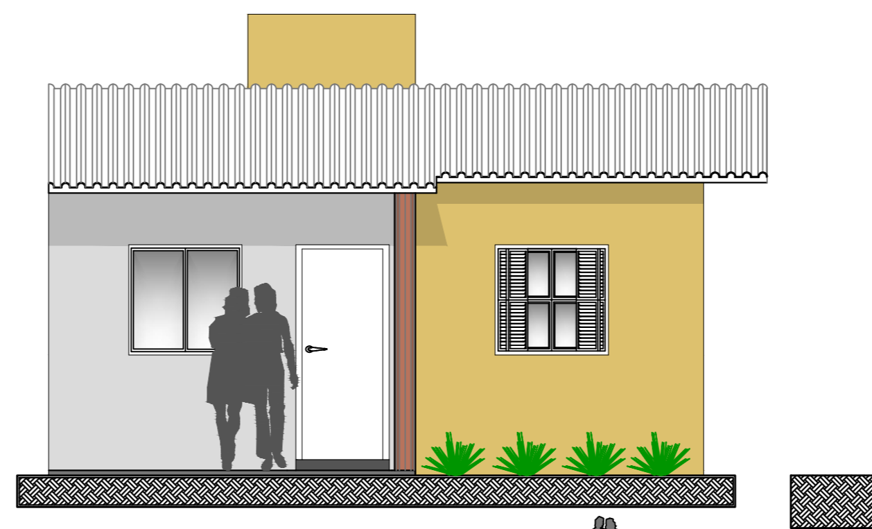
FACHADA FRONTAL ESCALA 1:50