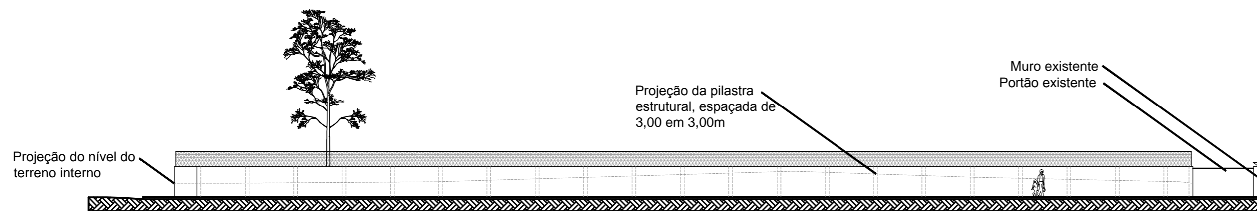
ELEVAÇÃO NORTE PROJETO DO NOVO MURO ESCALA 1:250