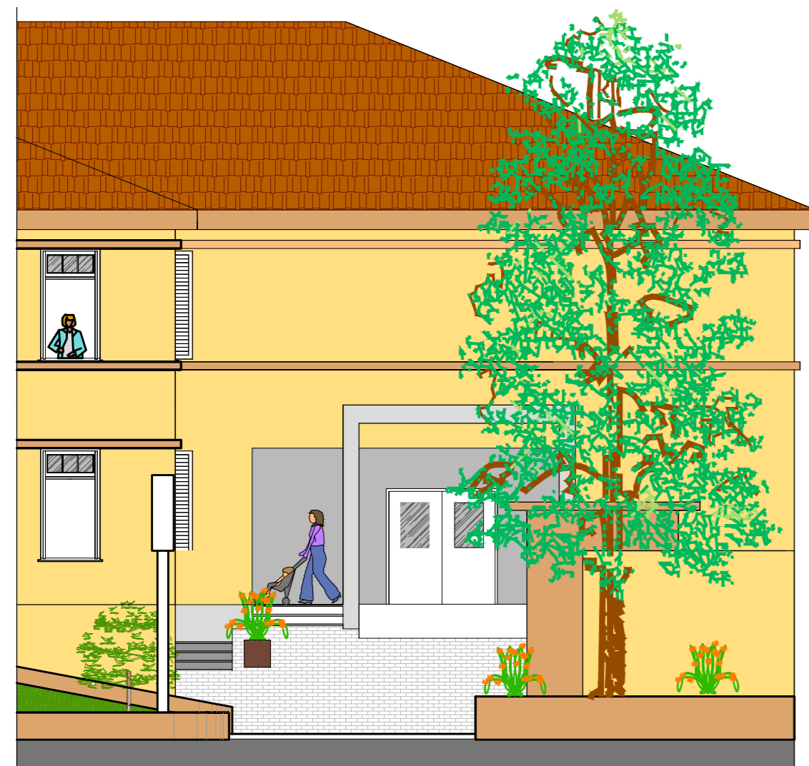
FACHADA - ESCALA: 1:100