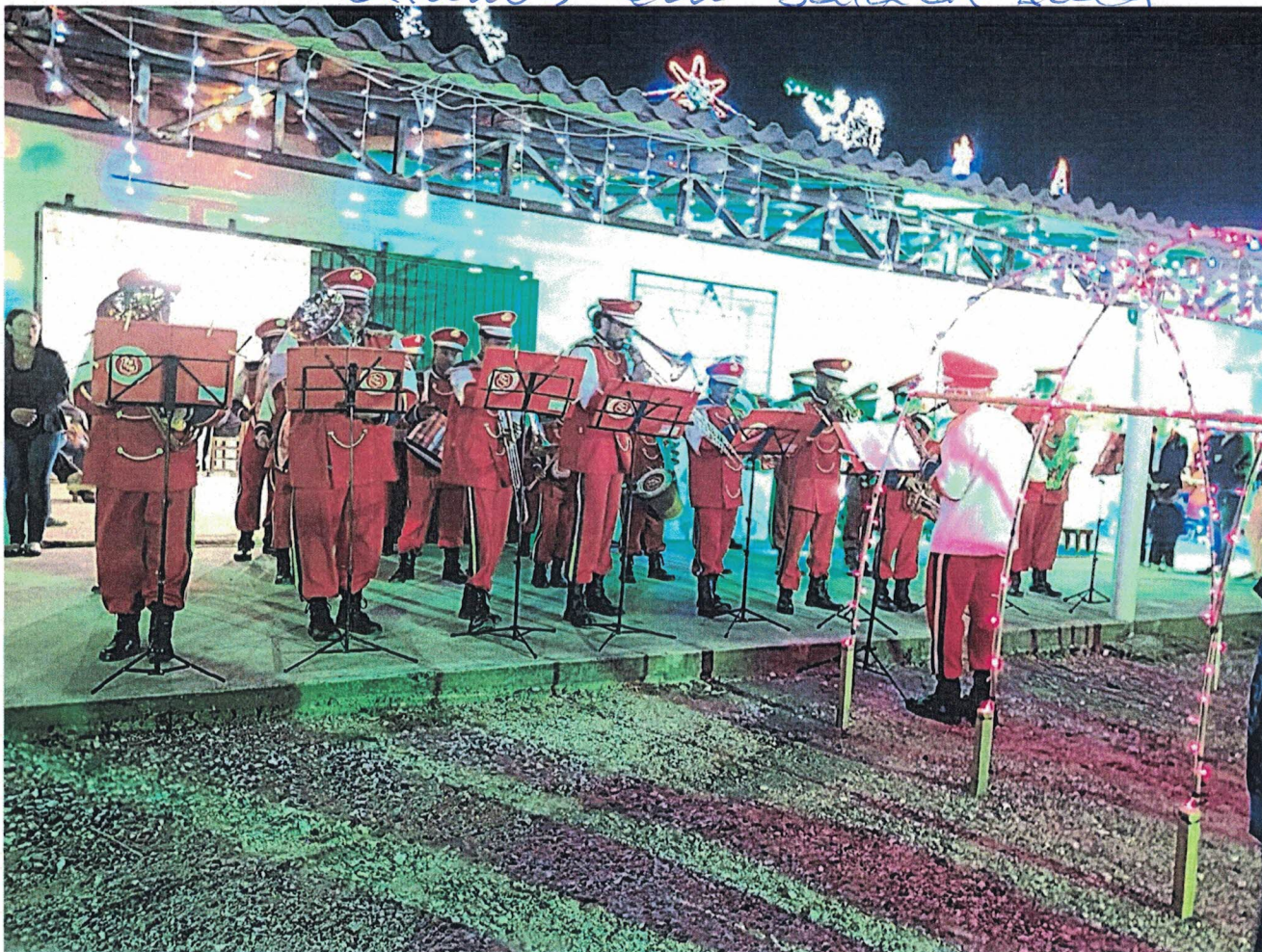
BMCCM NA COXILITA DE SÃO JOSÉ