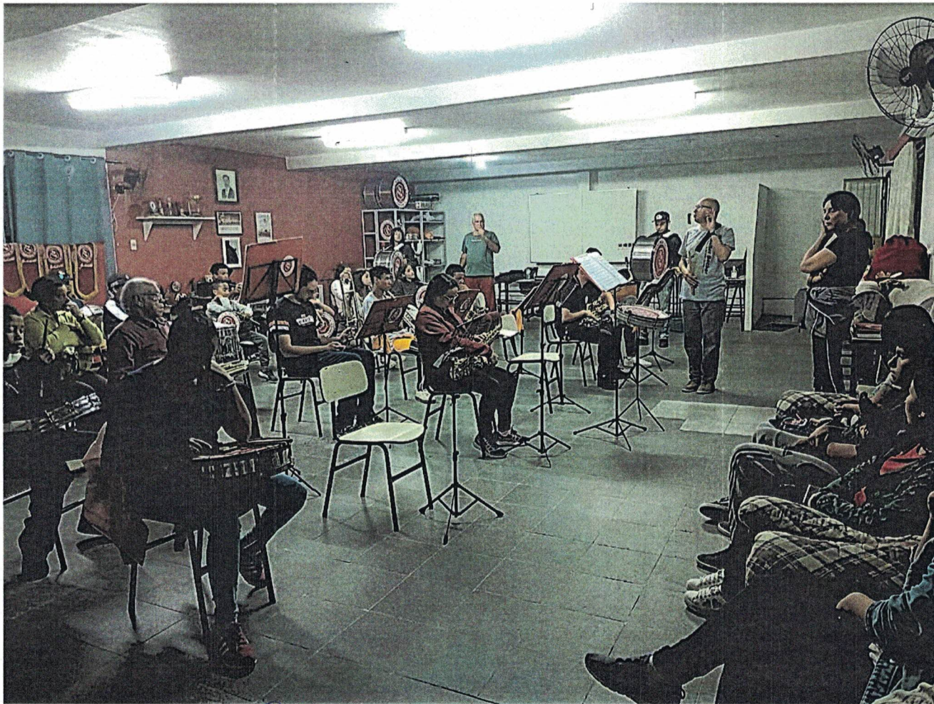
Alunos em sala de aula