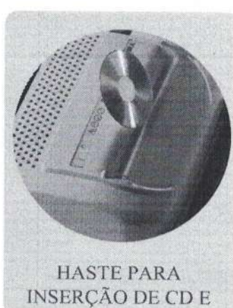
HASTE PARA INSERÇÃO DE CD E CARTÕES