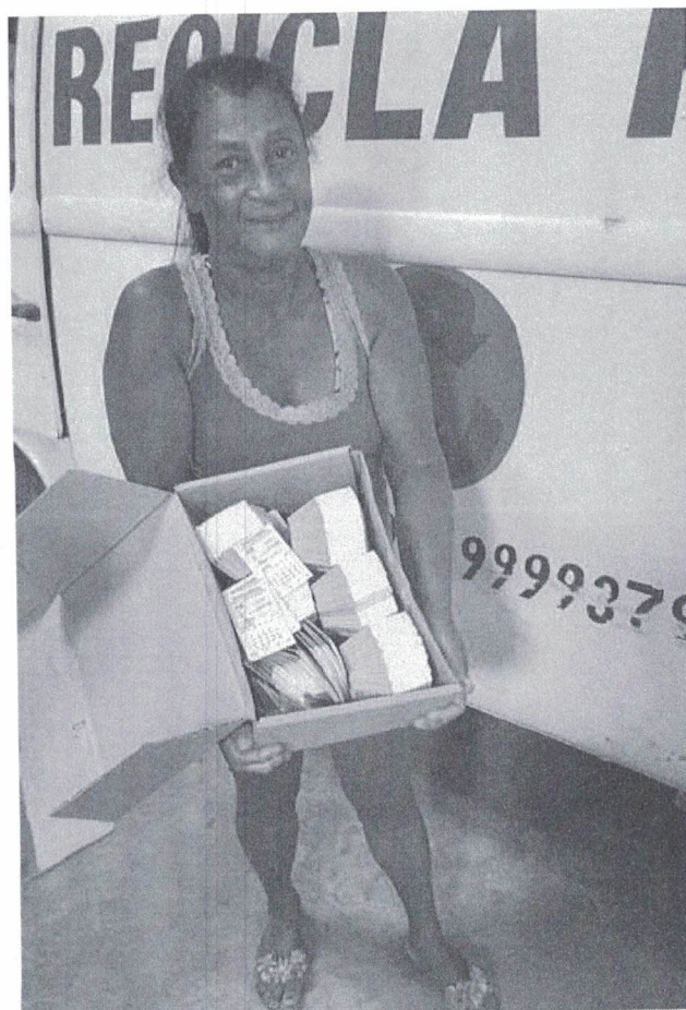
Figura 2 – Coordenadora com uma das caixas