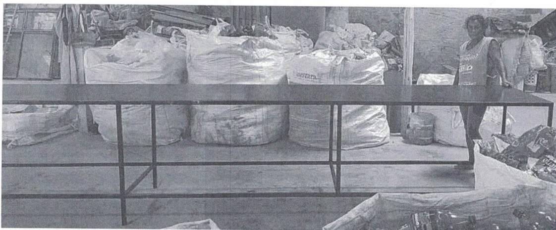
Figura 4 – Mesa de triagem feita sob medida