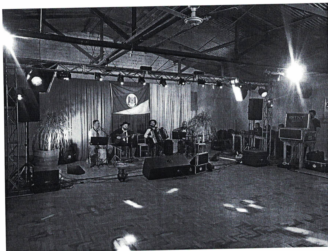
Foto 6: Conjunto Musical, estrutura de som, iluminação e filmagem.

DOCUMENTO EOI UTILIZ PI/ PRESTAÇÃO DE CONTA PREEITURA. CAÇAPAVA DO SU