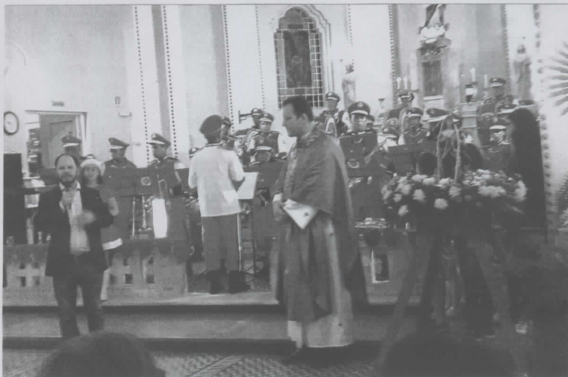
CONCERTO ENCANTO DE NATAL 21/12/2018 - IGREJA MTRIZ