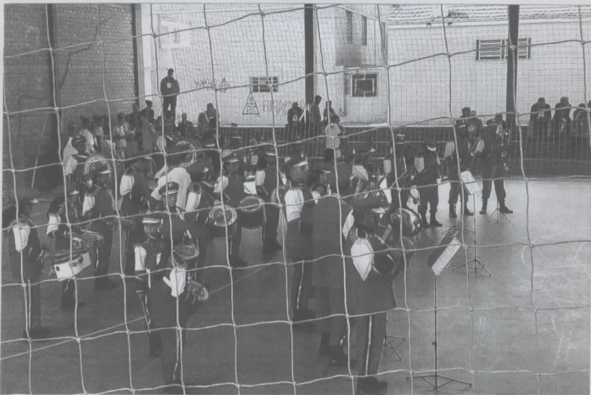
NATAL BRANCO - 02/12/2018 GINÁSIO DA CENSA