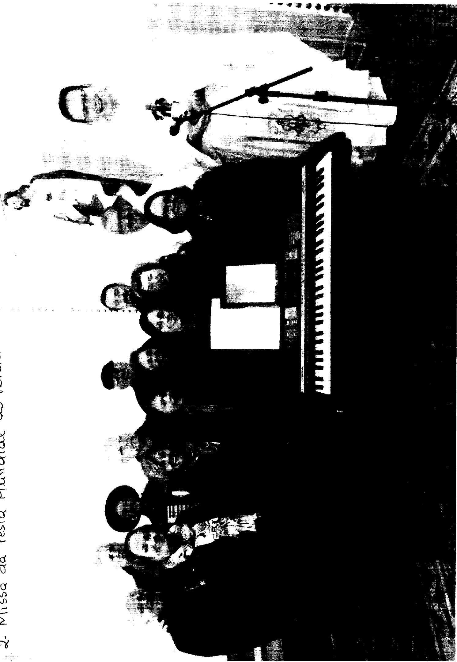
2. Missa da Festa Mundial do Folclore.