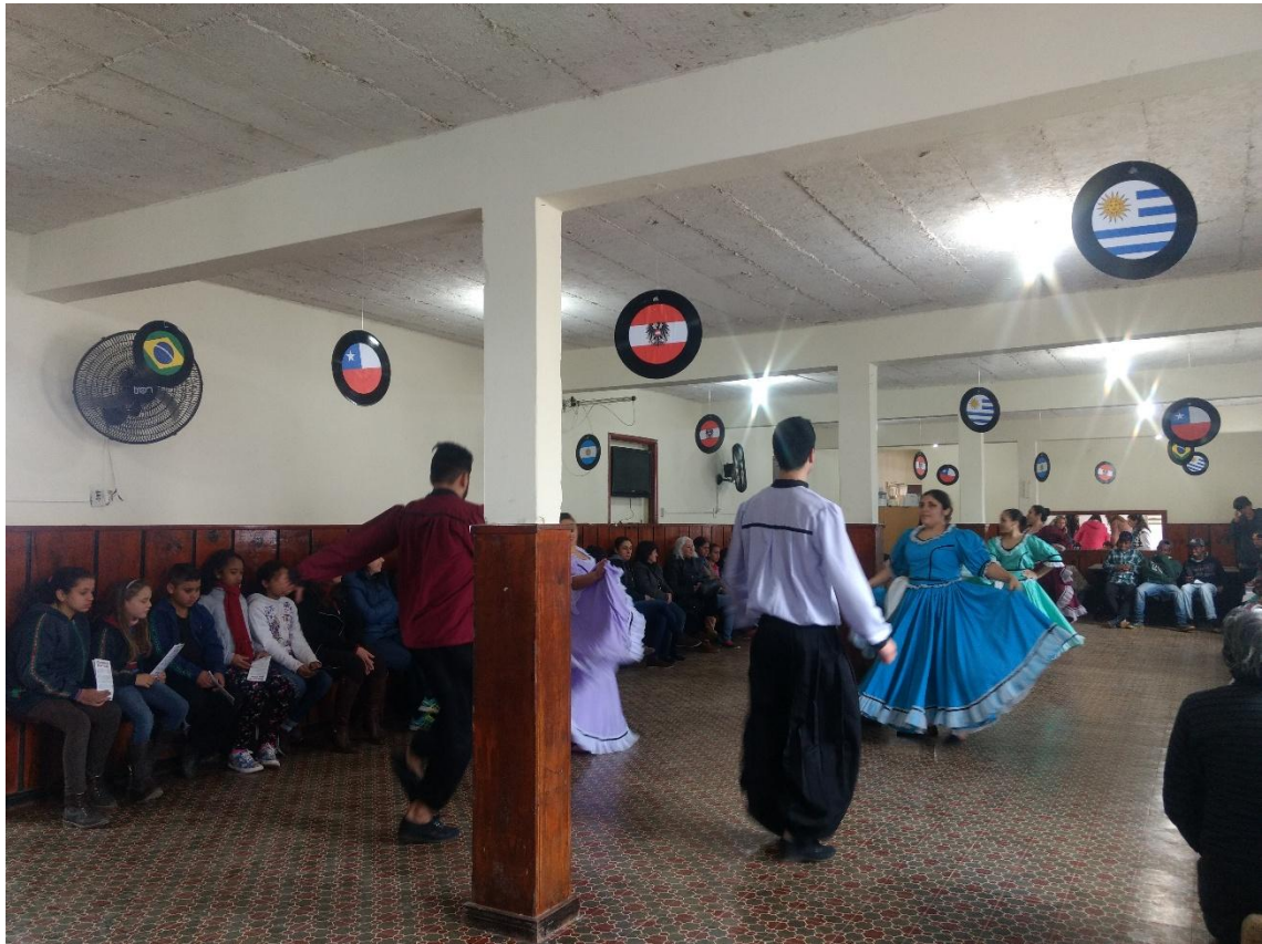
Apresentação na Escola Municipal Patrício Dias Ferreira