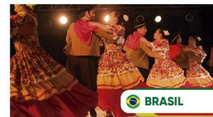
Grupo de Arte Nativa "Os Chimangos" Cidade de Caçapava do Sul