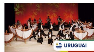
Ballet Tierra Adentro Cidade de Montevideo