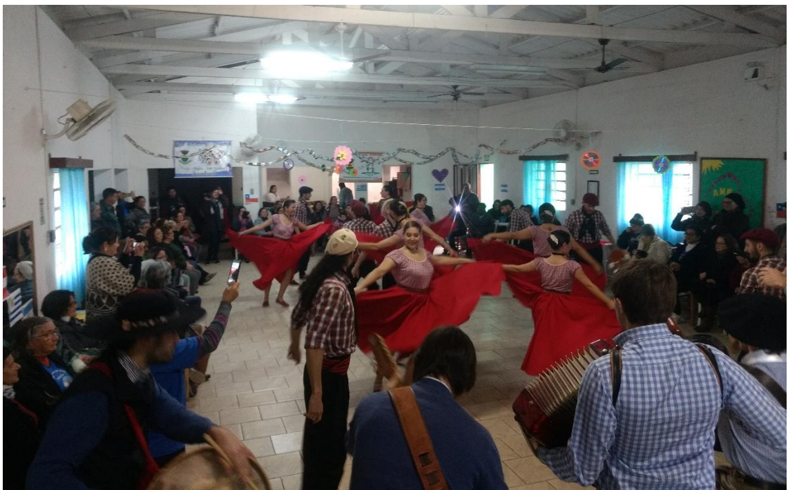
Apresentação no Clube da Melhor Idade Vivência