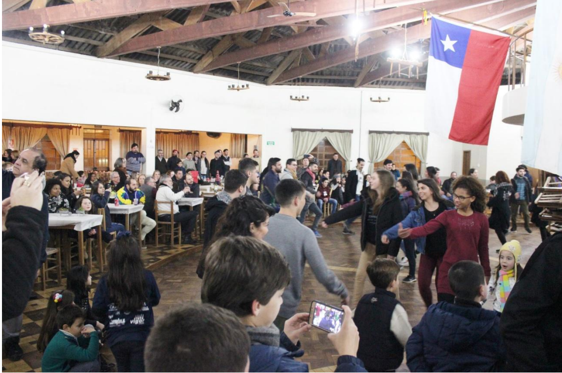
Jantar de Confraternização e Troca de Danças