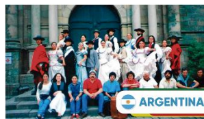
Ballet Martín Güemes Cidade de Córdoba