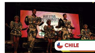
Ballet Folclórico Municipal de Lautaro Cidade de Lautaro