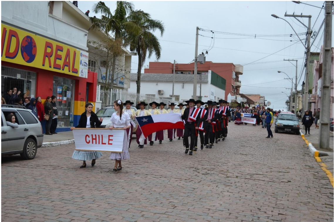
Desfile na rua XV de Novembro