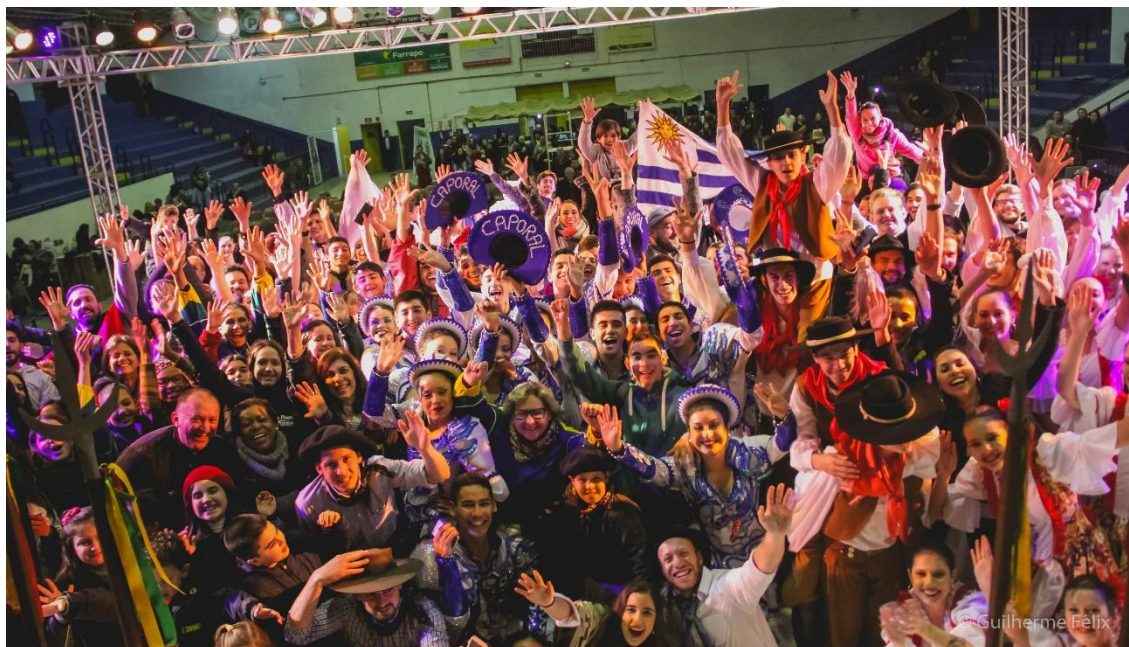
Encerramento dos Espetáculos