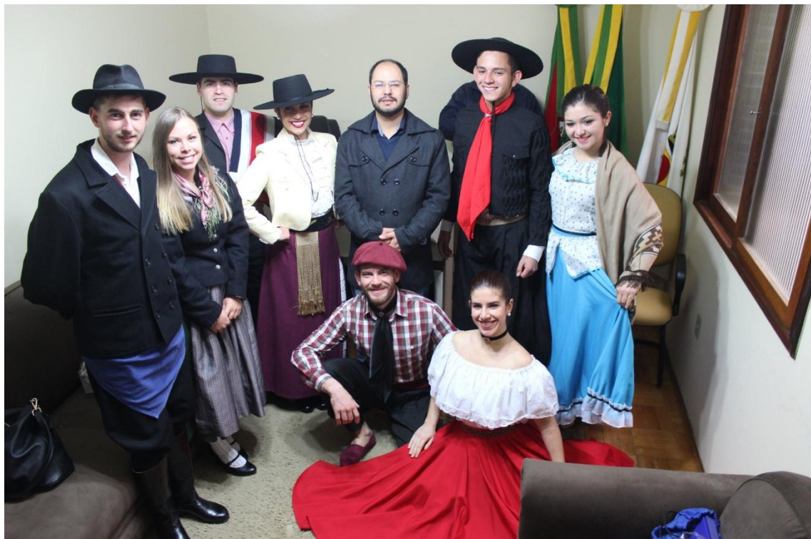
Recepção pelo Prefeito Municipal