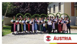
Volkstanzgruppe Schuetzen am Gebirge Cidade de Schuetzen am Gebirge