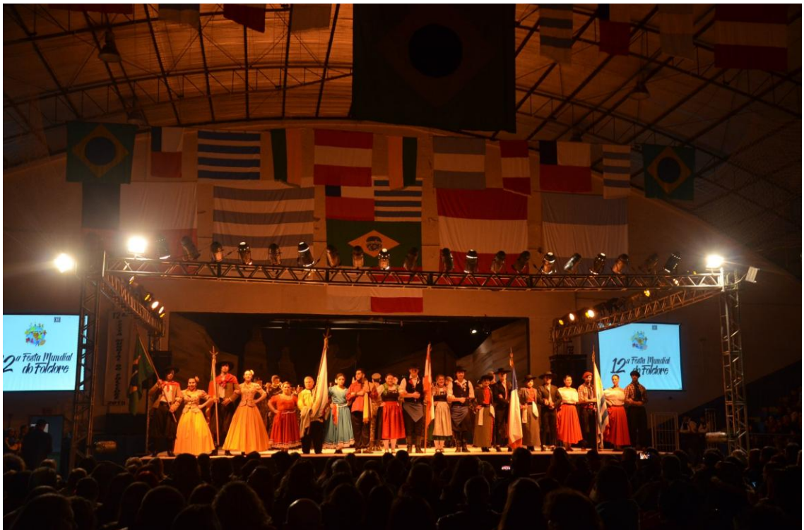
Abertura dos Espetáculos