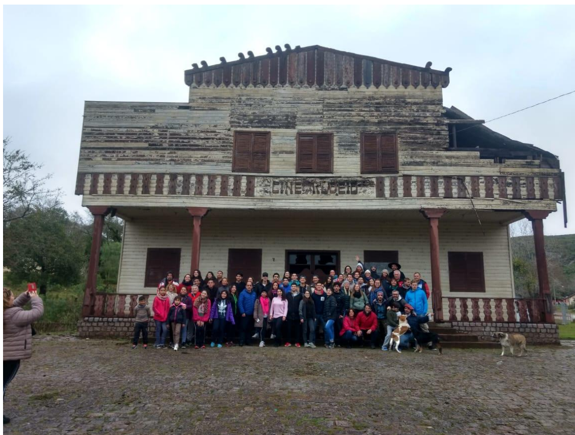
Passeio Turístico nas Minas do Camaquã e Guaritas