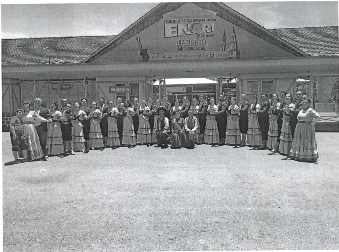
Foto 3 : Grupo adulto do CTG Sentinela do Forte, finalista do Enart 2019.